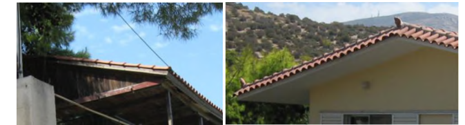
Αντιπαράθεση κεραμικών στεγνών. Αριστερά στέγη με ξύλινο υπόβαθρο, εύφλεκτη. Δεξιά, ταμμέντιν, δεν αναφλέγεται. Και στις δύο περιπτώσεις η βλάστηση ακουμπά στις στέγες, γεγονός που αυξάνει τον κίνδυνο από πυρκαγιά.

Μεταλλικά στοιχεία (σίδηρο, αλουμίνιο) δεν αναφλέγονται και δεν μεταδίδουν τη φωτιά. Όμως, μία κατασκευή με μεταλλικό σκελετό, αν εκτεθεί σε υψηλές θερμοκρασίες μπορεί να καταρρεύσει χωρίς προειδοποίηση.