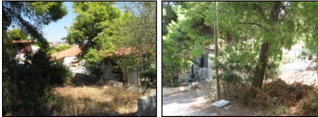
Παραδείγματα σπιτιών που απειλούνται από δασική πυρκαγιά λόγω της βλάστησης, των σκουπιδιών και της συσσωρευμένης νεκρής ύλης σε γειτονικούς χώρους.

Σημαντικό ρόλο για την πιθανότητα μιας κατοικίας να γλυτώσει σε περίπτωση πυρκαγιάς παίζουν τα υλικά κατασκευής της, η τοποθεσία και η βλάστηση που υπάρχει γύρω της. Γενικά ισχύει ο κανόνας ότι «μία κατοικία είναι τόσο ευάλωτη όσο το πιο αδύναμο σημείο της». Επίσης είναι σημαντική η δυνατότητα πρόσβασης πυροσβεστικών οχημάτων σε αυτήν, η προετοιμασία της κατοικίας και του περιβάλλοντος χώρου από τους ιδιοκτήτες αλλά και οι ενέργειές τους πριν και κατά την άφιξη της πυρκαγιάς.