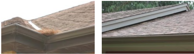
Αριστερά, συσσώρευση πευκοβελόνων στην υδρορροή. Δεξιά, σχετικά καθαρή στέγη.

Καθαρίζουμε τη στέγη μας από ξερές βελόνες και φύλλα, καθώς και όσες άλλες επιφάνειες του σπιτιού μπορεί να έχουν μαζέψει νεκρή φυτική ύλη (πχ υδρορροές).