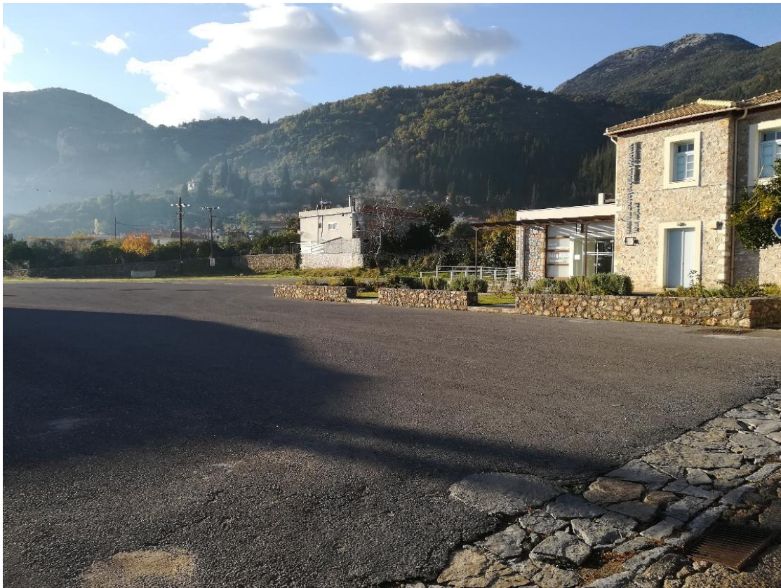
Εικόνα 1α: Χώρος στον οποίο πρόκειται να κατασκευαστεί η νέα παιδική χαρά της Τ.Κ Μυστρά