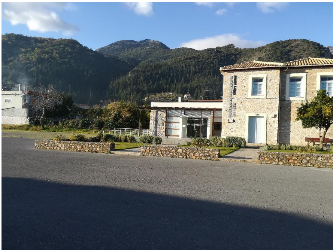
Εικόνα 1β: Χώρος στον οποίο πρόκειται να κατασκευαστεί η νέα παιδική χαρά της Τ.Κ Μυστρά

Για την δημιουργία της νέας παιδικής χαράς προβλέπεται περιληπτικά: