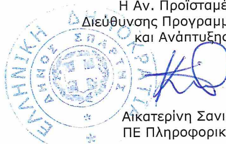
Αικατερίνη Σανιδά ΠΕ Πληροφορικής

Η Αν. Προϊσταμένη Διεύθυνσης Προγραμματισμού και Ανάπτυξης